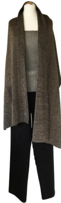
Abb.: Schal mit kleiner Tasche